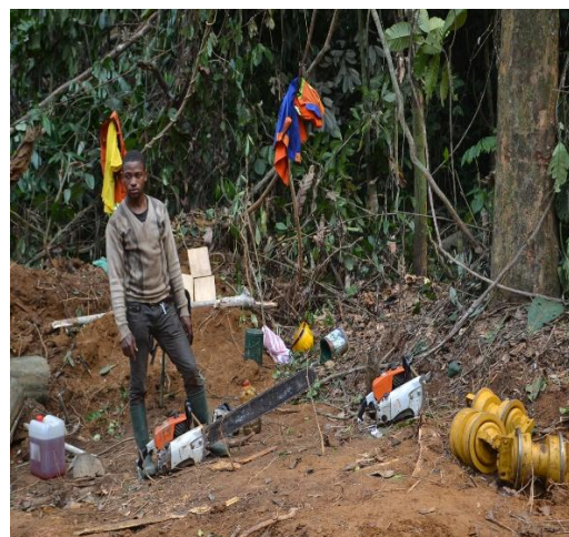
Photos 5&6 : Illustration du manque de matériel roulant et d'autres équipements