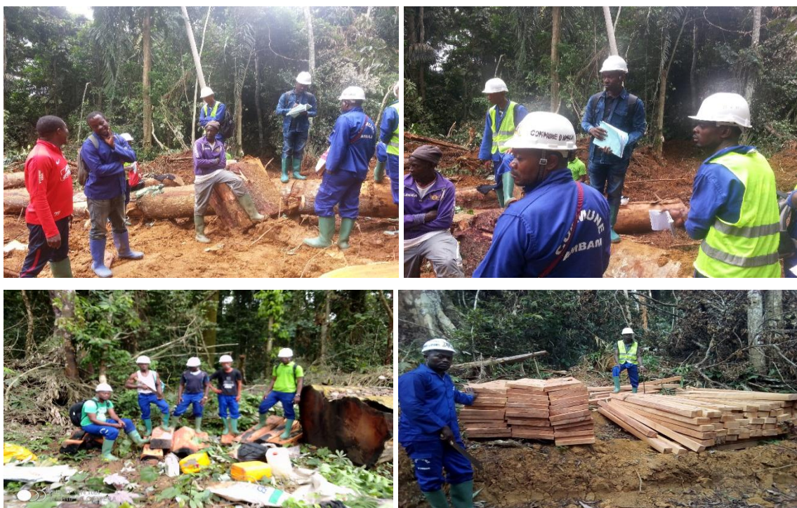
Photos 1, 2, 3&4: Surveillance et contrôle des activités de la FC

C'est ainsi que sept nouveaux membres ont été affectés dans la cellule de foresterie communale afin de renforcer la qualité et l'efficacité de ces services. Ainsi, une fiche de planification des descentes a été élaborée à cet effet afin de permettre un meilleur contrôle et suivi de la FC, regroupé en trois (03) équipes. Chaque équipe a deux (02) descentes par semaine : une descente pour contrôler l'évolution du chantier et la pépinière et une autre pour contrôler les anciennes entrées. Lors de ces descentes, les équipes sont chargées de sensibiliser les ouvriers sur le respect des normes pour une exploitation à impact réduit et traquer ; en collaboration avec les écocardes des postes de contrôle forestier (Meyo-Centre et Ambam), de la délégation ; les exploitants illégaux. Les apports de descentes donnent plus d'explication sur chaque descente (le but, le travail effectué et les obstacles).