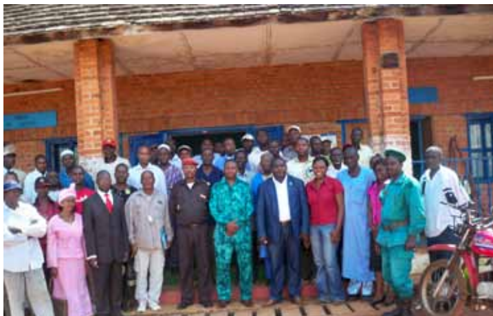
Photo 4 : Photo de famille restitution ESE de Doumé