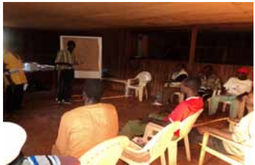
Photo 3 : Focus group avec les agriculteurs

L'échelle de la carte ne doit pas faire apparaître les différentes infrastructures ou construction villageoise mais plutôt l'espace environnant du village et plus spécialement l'espace à partir du village jusqu'au cœur du massif, seul la chefferie devra figurer sur la carte. Les éléments stratégiques qui devront être recensés sur la carte participative sont principalement : les axes d'accès au village, la chefferie, le réseau hydrologique avec la typologie des rivières pour établir une référence spatiale utile pour le positionnement des activités. Ajouter les ponts., les différents campements agricoles, de pêche, de chasse, de collecte des PFNL, les champs (cultures de rente et vivrières) susceptibles d'être localisés à l'intérieur des limites proposées ou arrêtées de la FC, les zones à forte concentration de PFNL, les sites sacrés et sites d'intérêts particuliers tels que les grottes, les chutes d'eau, les salines, les montagnes, les traces de l'exploitation forestière passée et actuelle à l'intérieur du massif forestier communal, les limites approximatives de la forêt communale sur la base du fond topographique restitué aux équipes, une légende et l'indication du Nord.