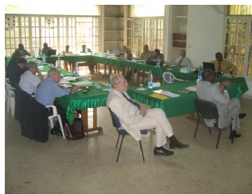
1. Vue de la salle du CP de janv10