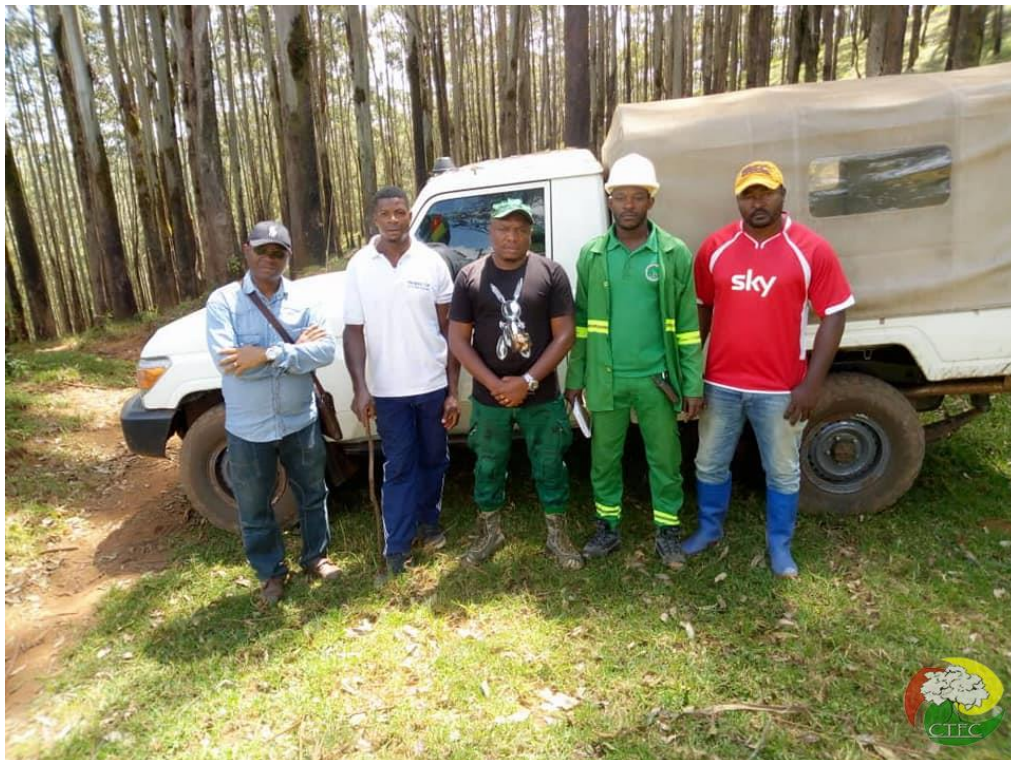
Photo 3 : Organisation des travaux d'entretien des plants dans la réserve forestière de Bapouh-Bana