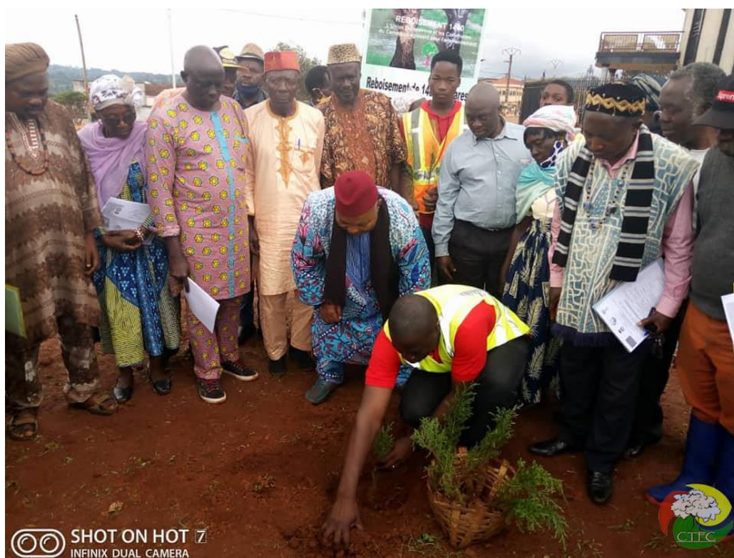
Photo 2 : Lancement de la Campagne sylvicole 2020 dans la mairie de Bangangté