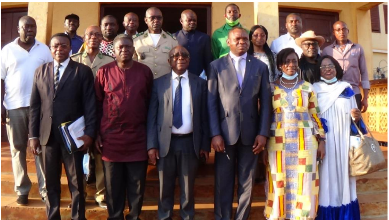
Photo 5 : Séance de travail avec le PNDP Ouest, les maires de Bangangté, Bangou et Bana pour l'organisation des travaux d'entretien dans la Réserve Forestière de Bapouh-Bana