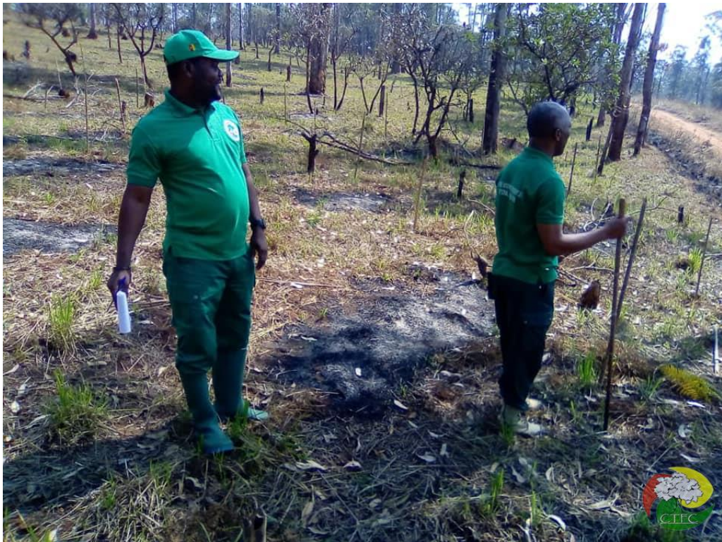
Photo 1 : Visite du DD MINFOF du Ndé sur le site de reboisement de la réserve de Balougoum