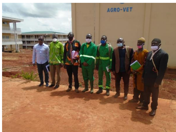
Photo 6 : Suivi des travaux de reboisement sur le site dégradé de Banekane au sein de l'Université des Montagnes (UdM)