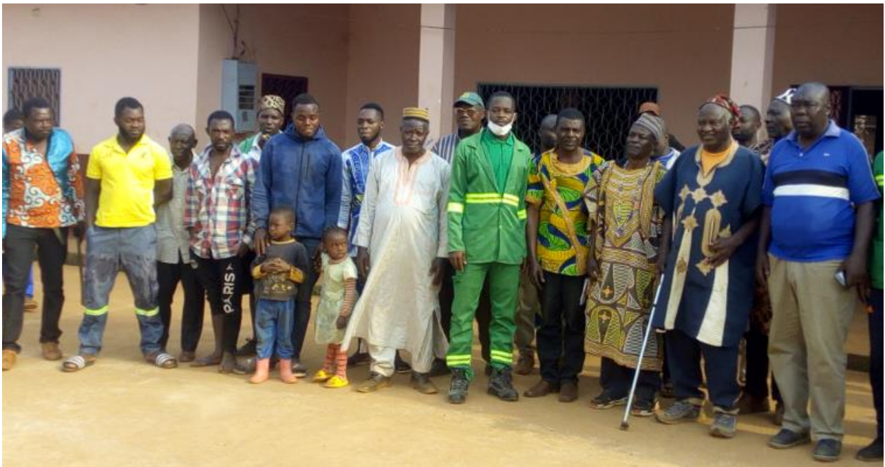
Photo 4 : Sensibilisation des organisations locales, des éleveurs et communautés riveraines sur les inconvénients du feu de brousse et du pâturage dans les sites de reboisement