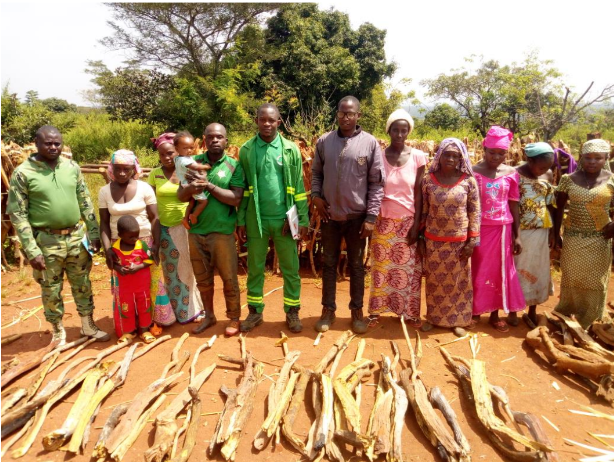
Photo 4 : Sensibilisation des responsables communaux, populations riveraines sur les aspects de légalité du bois et d’approvisionnement du marché domestique en bois légal