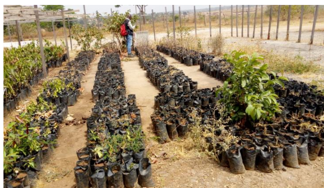
Photo 1 : Pépinières d'anacardiens et de manguiers de la commune de Nyambaka