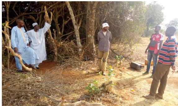
Photo 2 : Suivi des plantations dans les sites de reboisement de la commune de Nyambaka