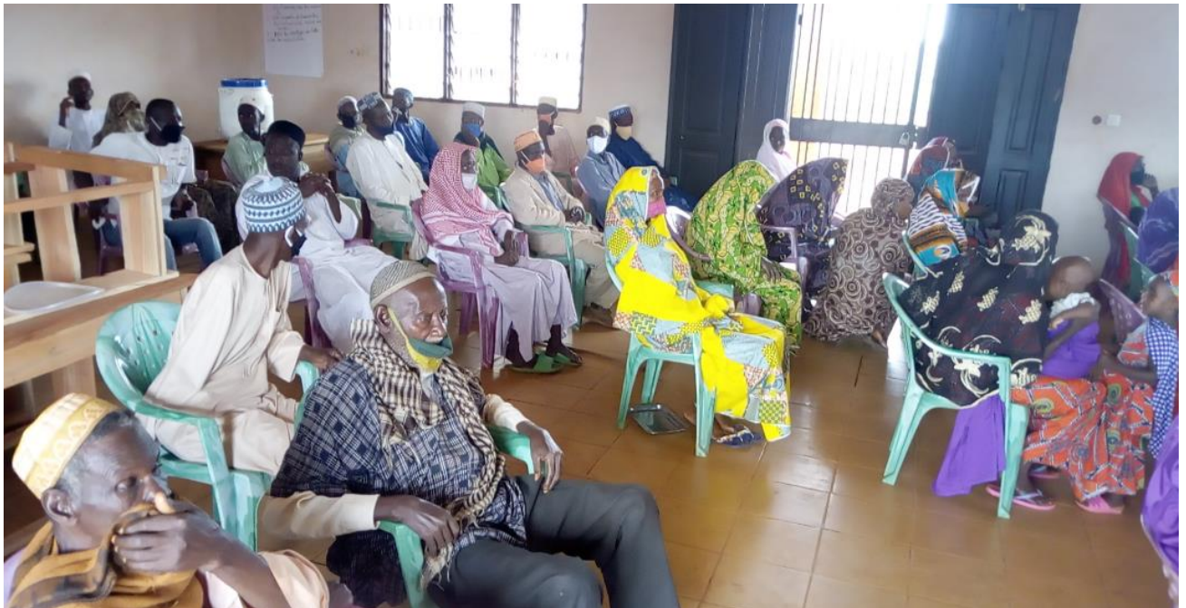
Photo 3 : Sensibilisation des populations (jeunes, femmes, enfants) et autres acteurs impliqués dans les activités du projet reboisement