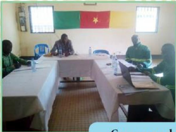
Commune de Tonga