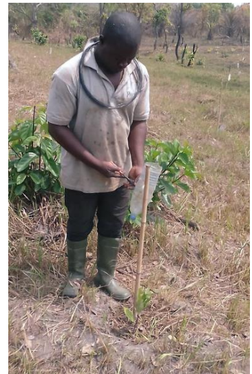
Photo 1 : Suivi des Travaux d'entretien et d'arrosage des plants dans les sites de reboisement de la Commune de Tonga