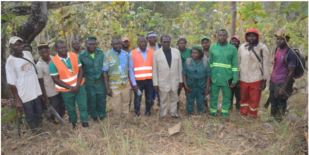
Photo 3 : Visite guidée des sites de reboisement par le Sous-préfet de l'arrondissement de Tonga