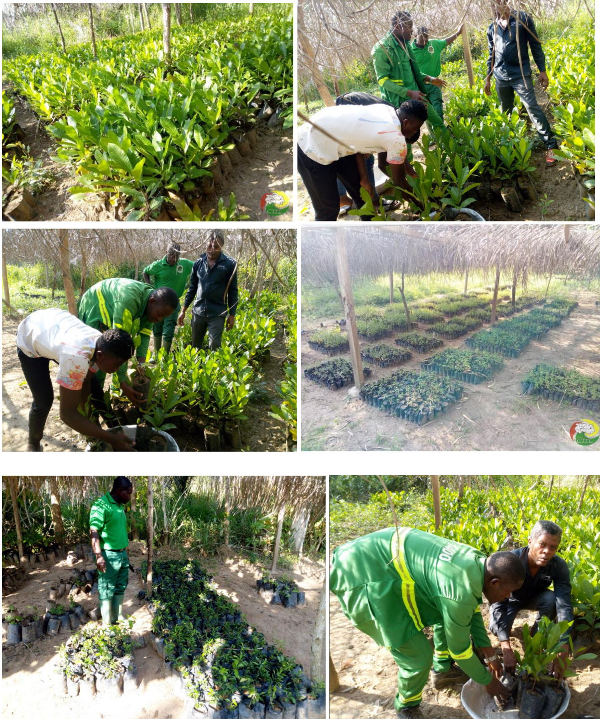
Photo 2 : Pépinière communale de Tonga, Distribution des plants aux agriculteurs locaux